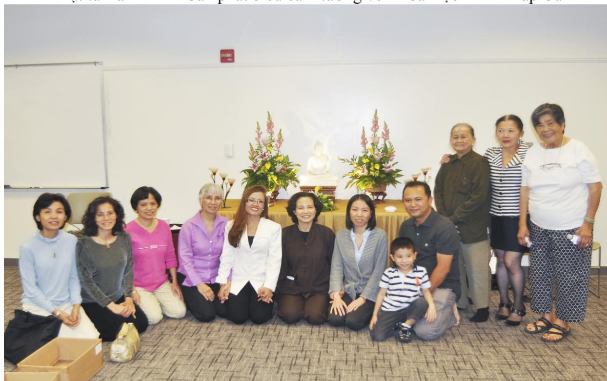
Tặng thân Thiện Đức và quý thân hữu.