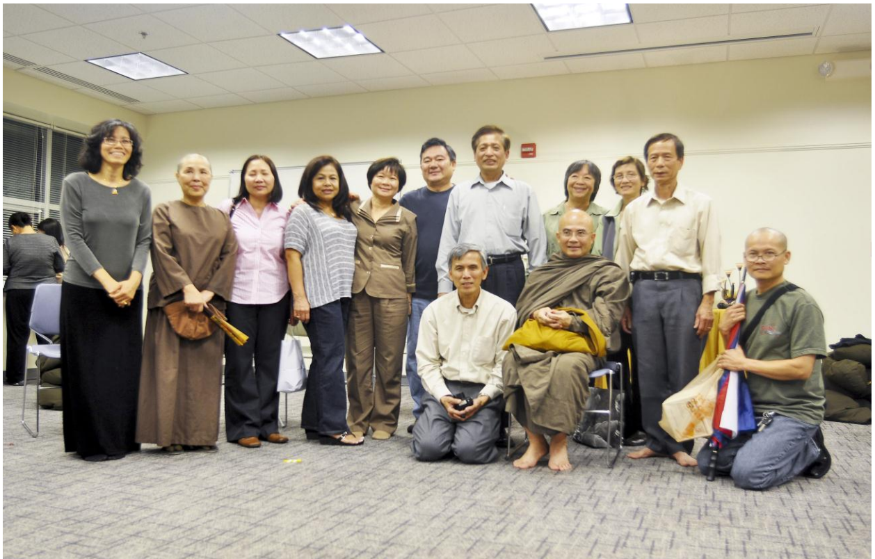
Đại chúng sinh hoạt vui vẻ với nhau trong Ngày Bế Giảng Khóa Học Kinh Pháp Cú.