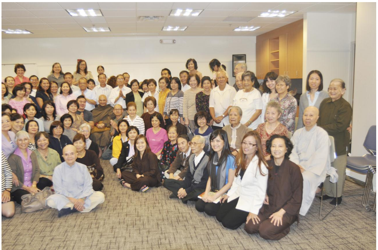
Đại chúng sinh hoạt vui vẻ với nhau trong Ngày Bế Giảng Khóa Học Kinh Pháp Cú.