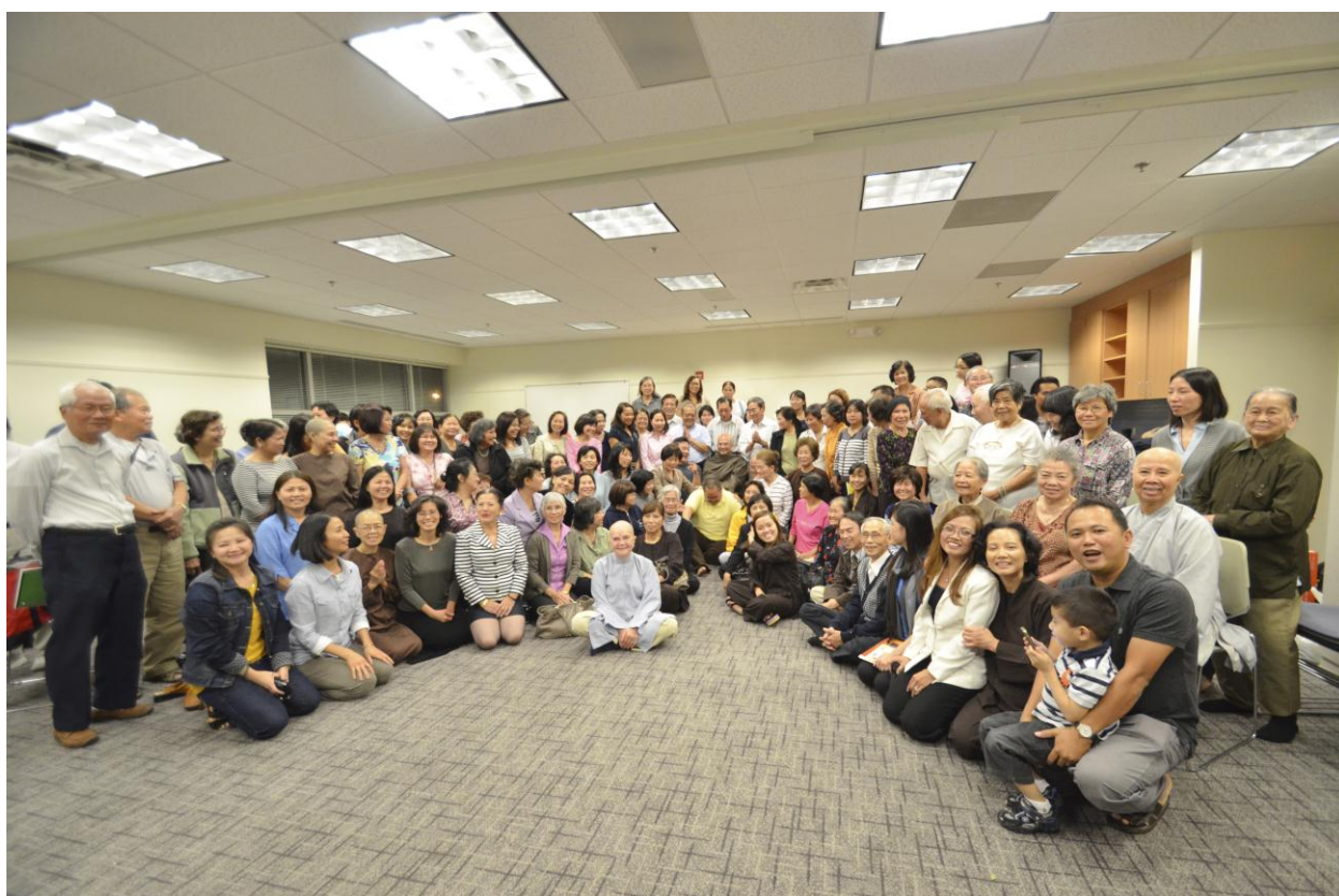
Đại chúng sinh hoạt vui vẻ với nhau trong Ngày Bê Giảng Khóa Học Kinh Pháp Cú